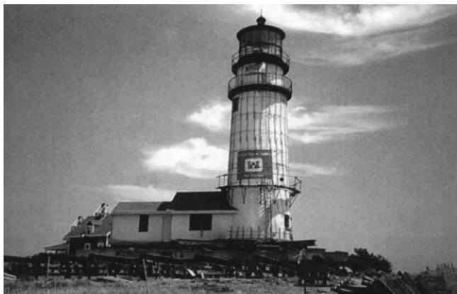
Rys. 3. Przesunięcie latarni morskiej w Cape Cod [1]

Duża część powierzchni Stanów Zjednoczonych Ameryki jest co roku zagrożona powodzią oraz zniszczeniami w wyniku działania erozji brzegu. Te działania natury spowodowały, że ludzie zaczęli przewozić swoje domy w inne, bezpieczniejsze lokalizacje [1].