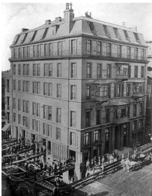
Rys. 2. Przeniesienie hotelu Pelham w Bostonie w 1857 r. [1]

Wybudowany w 1857 roku hotel Pelham oferował niedrogie pokoje w dobrej lokalizacji, niedaleko dzielnicy biznesowej w Bostonie. Był to pierwszy apartamentowiec w USA, zaprojektowany aby odzwierciedlał akademicki styl. Część budynku była wykorzystywana komercyjnie, reszta pełniła funkcje mieszkalne. Przebudowa ulicy Tremont w 1869 roku skłoniła właściciela do przesunięcia budynku o niewiele ponad 4 m w kierunku zachodnim. Waga obiektu była oszacowana na pięć tysięcy ton. Relokacja odbyła się przy użyciu dziewięciuset czterech rolek, z wykorzystaniem 72 śrub przesuwających obiekt wzdłuż szyn. Relokacja odbywała się z prędkością około 2,5 cm w czasie 5 minut. Cała relokacja trwała prawie trzy miesiące (rys. 2). W tym czasie obiekt pracował normalnie, wszystkie media (woda, kanalizacja, gaz i prąd) cały czas były dostępne. Pomimo zaangażowania właścicieli w roku 1916 hotel został wyburzony i na jego miejsce wybudowano nowy obiekt. Hotel Pelham z Bostonu uważany jest za pierwszy tak duży obiekt, który został poddany relokacji [1].