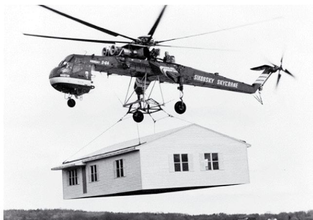
Rys. 5. Relokacja budynku armii amerykańskiej w 1962 roku w Wietnamie [11]

Wśród nietypowych relokacji obiektów można wyróżnić te przy użyciu helikoptera (rys. 5). Na zdjęciu widać helikopter Sikorsky CH-54 Tarhe, używany przez amerykańską armię. Ten helikopter transportowy mógł podnieść obiekty o maksymalnej wadze dwudziestu jeden ton. Pierwszy raz został użyty w 1962 roku w Wietnamie.