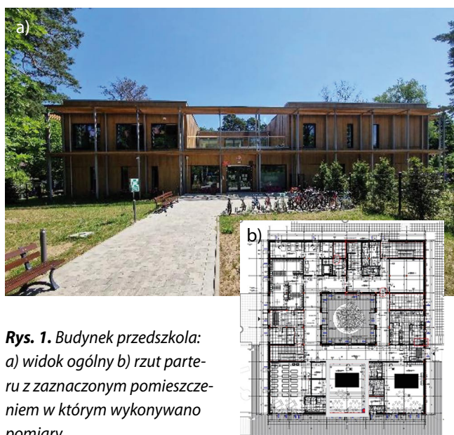
Rys. 1. Budynek przedszkola: a) widok ogólny b) rzut parteneru z zaznaczonym pomieszczeniem w którym wykonywano pomiary

w technologii modułowej, oddany do użytkowania w 2021 roku. Jest to budynek dwukondygnacyjny, o kubaturze 7809 m 3 , wybudowany w układzie atrialnym z dziedzińcem w części centralnej. W obiekcie znajduje się pięć sal zabaw i jedna sala, o uniwersalnej funkcji z przeznaczeniem na prowadzenie zajęć rytmicznych, rehabilitacyjnych i integracji sensorycznej. Ażurowa elewacja chroni wnętrze obiektu przed przegrzewaniem w lecie. Ogólny widok przedszkola oraz rzut kondygnacji parteru z zaznaczoną salą, w której wykonywano pomiary przedstawiono na rysunku 1.