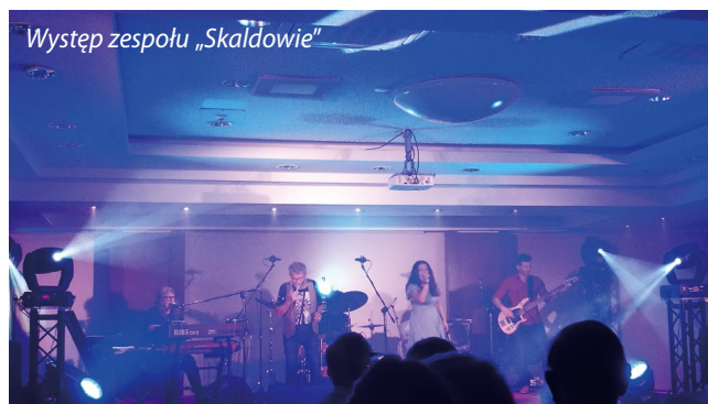
Występ zespołu „Skaldowie”

Dodatkowo w trakcie warsztatów ogłoszono 11 wykładów firmowych i 4 prezentacje. Wykłady zostały opublikowane w formie 2-tomowego wydawnictwa konferencyjnego o łącznej objętości ponad 700 stron.