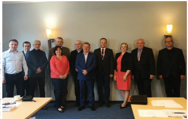
Spotkanie Klubu Prezesów Oddziałów PZITB Polski Południowej