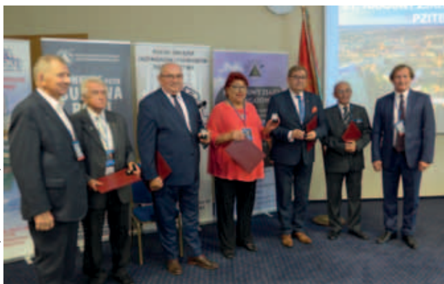
Wręczenie Godności Członka Honorowego PZITB