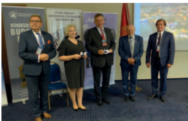
Nagrodzeni Srebrną i Złotą Honorową Odznaką z Diamentem PZITB