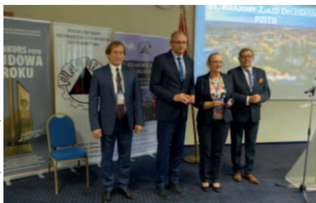
Przyznanie Honorowej Złotej Odznaki z Diamentem PZITB