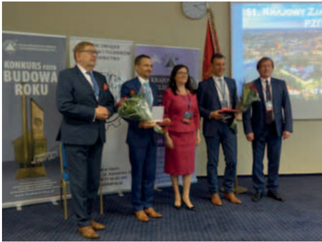
Wręczenie Nagród im. prof. Aleksandra Dyżewskiego