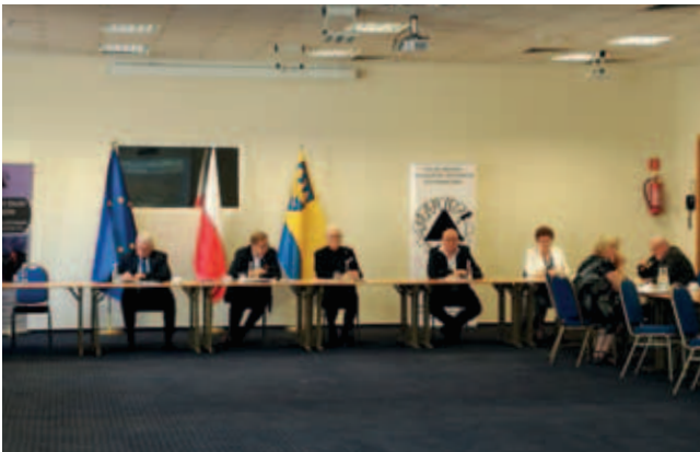
Ostatnie posiedzenie ZG PZITB w kadencji 2016–2020