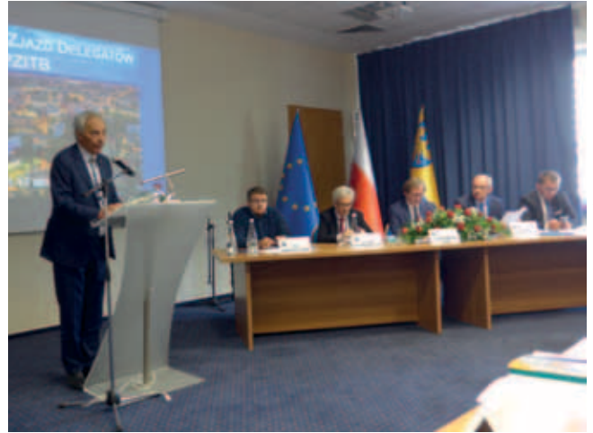
Laureat Medalu im. prof. Stefana Kaufmana