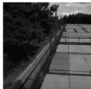
Rys. 3. Ściany parteru z kształtkami wieńcowymi

dwuwarstwowe grubości 34 cm, murowane z pustaków ceramicznych poryzowanych grubości 18,8 cm, łączonych klejem murarskim poliuretanowym, ocieplone od zewnątrz warstwą styropianu grubości 15 cm, wykończone od wewnątrz tynkiem gipsowym grubości 1,5 cm, a od zewnątrz tynkiem cienkowarstwowym silikonowym; współczynnik przewodności cieplnej takiej ściany wynosi U = 0,20 \text{ W}/(\text{m}^2\cdot\text{K}) . Ściany wewnętrzne konstrukcyjne grubości 18,8 cm (pomędzy segmentami 2 \times 18,8 \text{ cm} , rozdzielone warstwą styropianu grubości 2 cm), murowane są z pustaków ceramicznych i wykończone tynkiem gipsowym 2 \times 1,5 \text{ cm} .