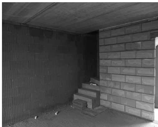
Rys. 5. Ściana działowa wykonana na zaprawie zwykłej

Mury z reguły wznoszone są z elementów murowych z profilowanymi płaszczyznami bocznymi, co pozwala na wykonywanie ścian z niewypełnionymi spoinami pionowymi.