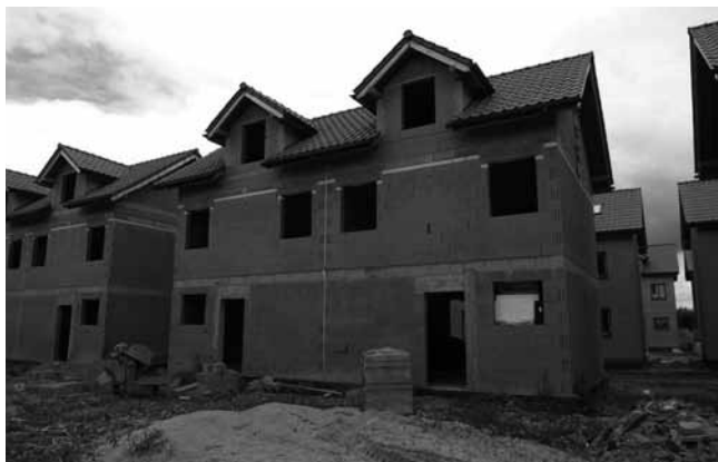
Rys. 2. Przykładowa elewacja budynku

producentami elementów murowych, stosujące wytyczne producentów dotyczące zasad murowania i montażu wytwarzanych przez nich elementów.