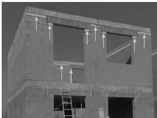
Rys. 1. Stosowanie elementów uzupełniających wynikające z braku rozwiązań modułowych

Podstawowym warunkiem wznoszenia murów w tej technice murowania jest stosowanie elementów murowych o dużej dokładności wykonania na wysokości – nie przekraczającej \pm 0,3 mm. Taką dokładność wymiarów można uzyskać w procesie produkcji jedynie przez szlifowania powierzchni wspornych, co jest już wykonywane przy produkcji elementów murowych ceramicznych. W tej technice murowania mogą być również wznoszone mury z bloczków z betonu komórkowego, gdzie na budowie wyrównywane są kolejne warstwy muru. Istotny wpływ na jakość murów wznoszonych w technice klejenia ma pierwsza warstwa zaprawy, wykonywana z reguły z zaprawy zwykłej, która powinna umożliwiać idealnie poziome ułożenie pierwszej warstwy elementów murowych (zaprawa wyrównująca).