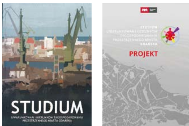
Rys. 1. Obowiązujące SUIKZP z 2007 r. i projekt nowego SUIKZP z 2017 r.

Ostatnie lata były okresem bardzo intensywnego rozwoju Gdańska i znaczących zmian przestrzennych: powstały od dawna oczekiwane i zaplanowane inwestycje komunikacyjne, rozwinęły się główne funkcje miastotwórcze, powstało wiele nowych miejsc pracy, poprawiła się jakość życia mieszkańców, wzrosła atrakcyjność zamieszkiwania w Gdańsku, co m.in. zahamowało odpływ ludności. Obowiązujący w dalszym ciągu dokument stworzył sprzyjające warunki do rozwoju przestrzennego w duchu zasad rozwoju zrównoważonego, akcentując rozwój miasta do wewnątrz, zapewniając m.in. ochronę wartości przyrodniczych i kulturowych. Zabezpieczył przestrzeń dla rozwoju węzłowych gałęzi gospodarki: morskiej, turystycznej i sektora opartego na wiedzy. Jak widać, dokument sprzed 10 lat trafnie przewidywał generalne kierunki rozwoju miasta. Jednak w tym