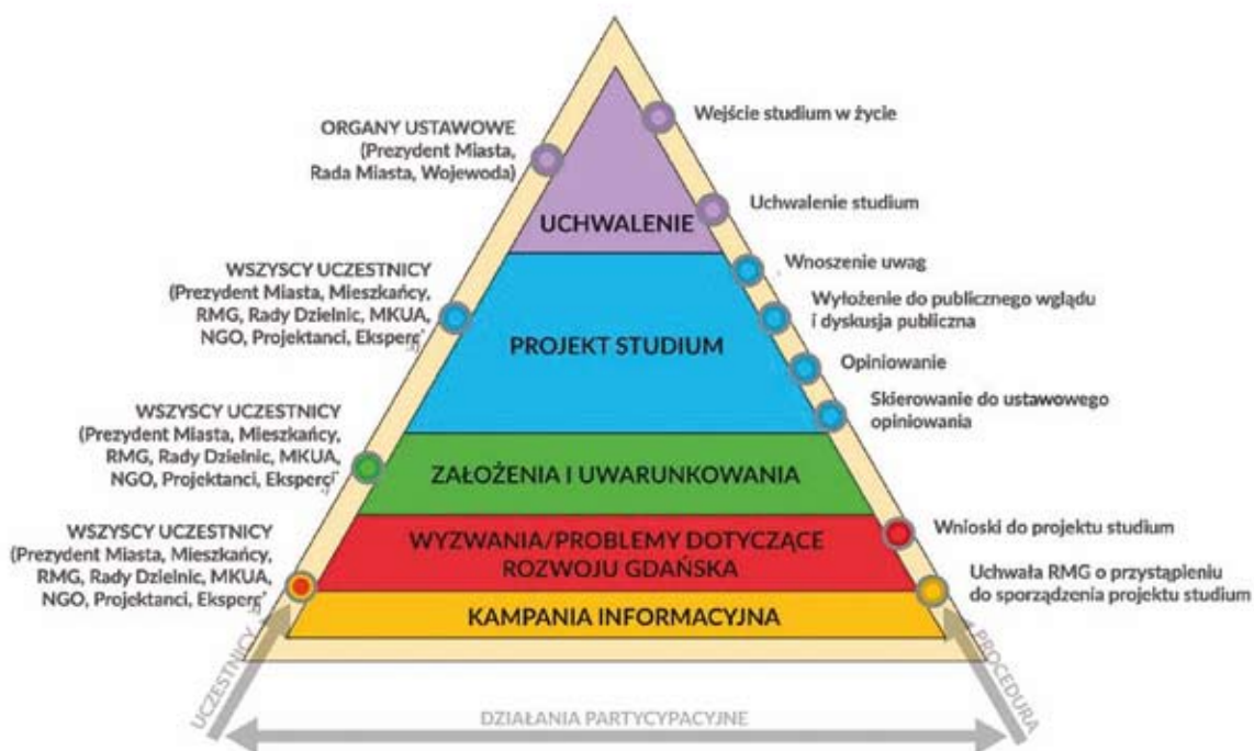
Rys. 2. Gdański model partycypacji społecznej

talność zapewniającą powstawanie nowych miejsc pracy i czy przewidziano tereny pod nowe parki, nowe linie tramwajowe, drogi? Na te pytania i na wiele innych znajdziemy odpowiedź w studium.