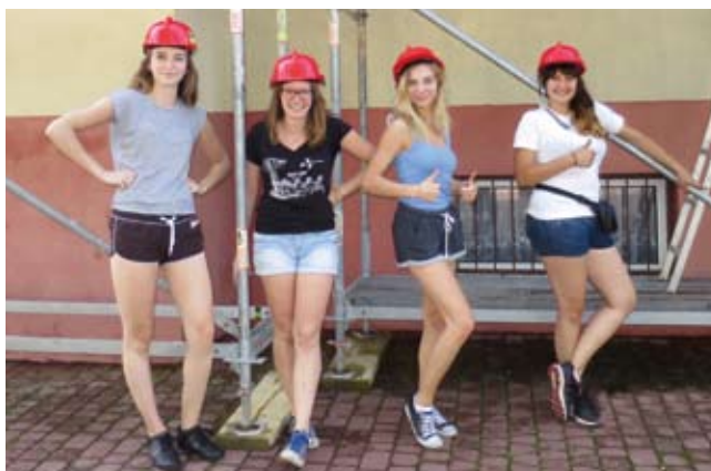
Koleżanki z Politechniki Łódzkiej uczestniczące w projekcie Workcamp Piotrków Trybunalski

Prace zostały zakończone w ciągu jednego miesiąca. Udało się wykonać łącznie ok. 1200 m 2 mycia elewacji,