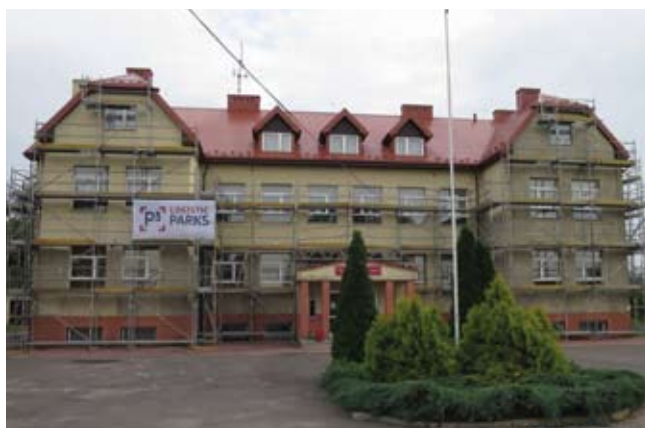
Efekt widoczny w trakcie mycia

Założenia projektu Workcamp zostały przedstawione wójtowi gminy Grabica w maju 2016 r. celem wyboru budynku, który można objąć remontem. W spotkaniach uczestniczyli także przedstawiciele firmy P3 logistic parks, która była głównym sponsorem przedsięwzięcia. Wójt pomógł znaleźć odpowiedni obiekt. Ostatecznie wybór padł na Szkołę Podstawową w miejscowości Brzoza. Budynek wymagał prac remontowych, ponieważ przez szereg lat nie był objęty inwestycją. Elewacja budynku szkoły pokryta była licznymi zabrudzeniami oraz glonami, które powodowały powolną degradację wykonanego docieplenia.