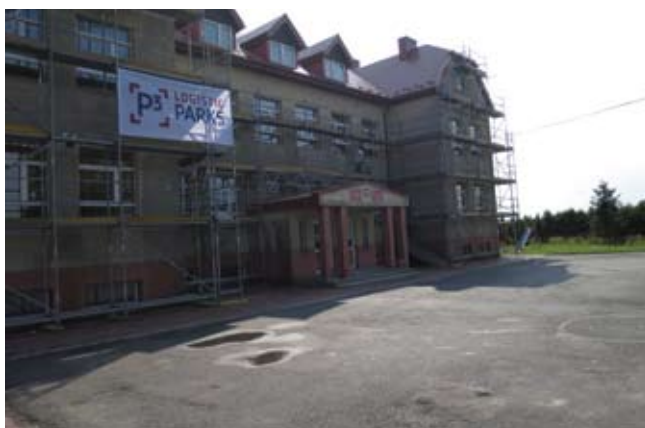
Stan budynku przed umyciem

rektorem szkoły, było oczyszczenie elewacji budynku szkoły, umycie i malowanie budynku starej sali gimnastycznej, malowanie ogrodzenia stalowego na podmurówce klinkierowej, bram wjazdowych, krat w oknach budynku, balustrad oraz drzwi wewnątrz budynku.