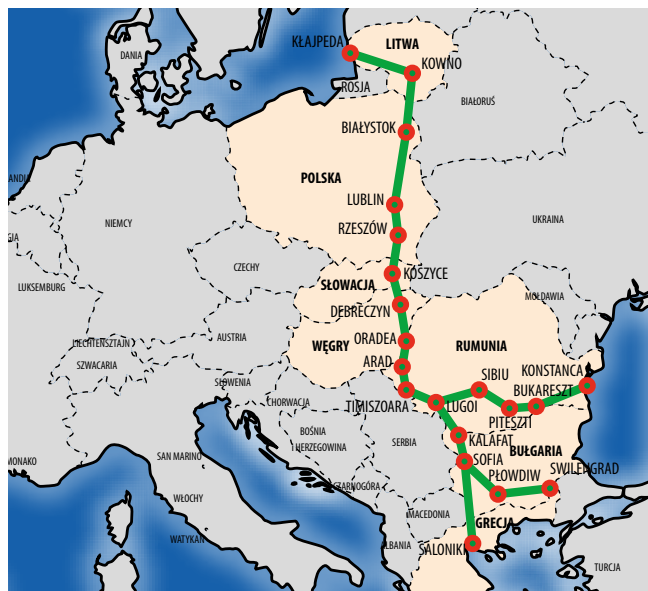
Trasa Via Carpathia