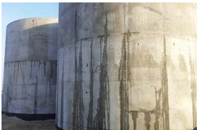
Rys. 1. Widoczny obraz zarysowań zbiorników od strony południowej (na pierwszym planie zbiornik nr 1)