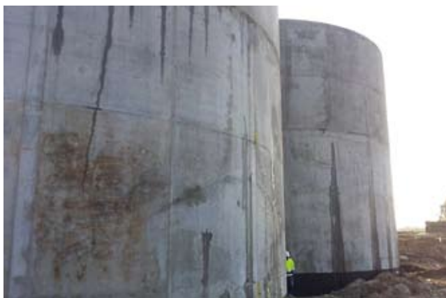
Rys. 2. Widoczny obraz zarysowań zbiorników od strony południowo-zachodniej (na pierwszym planie zbiornik nr 2)

posadowienia ww. płyt przyjęto na głębokości 1,00 m poniżej poziomu terenu.