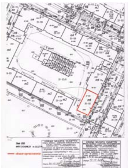
Rys. 1. Lokalizacja budynku w pierzei przy ul. Sienkiewicza w Olsztynie

Budynek został wybudowany przed II Wojną Światową i jest zlokalizowany przy ul. Sienkiewicza w Olsztynie. Prawdopodobnie w wyniku zniszczeń wojennych budynek został odbudowany po wojnie. Ulica Sienkiewicza do roku 1945 nosiła nazwę Sandgasse (Zaułek Piaska). Ulica znajduje się w południowej części osiedla Zatorze. Przedmiotowy budynek zlokalizowany jest na działce nr 20/132 obręb Olsztyn (rys. 1).