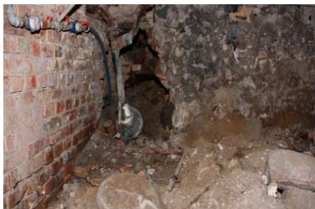
Rys. 6. Uszkodzenia konstrukcji ściany piwnicznej w miejscu przyłącza kanalizacyjnego

nadprożem i podokiennikiem. Szerokość zarysowania znacznie mniejsza – w skrajnych przypadkach maksymalnie 2 mm. W trakcie oceny stanu technicznego obiektu dokonano wnikliwej analizy stanu zachowania konstrukcji. Wstępnie założono, że genezą zarysowania konstrukcji murowej jest zły stan fundamentów. Podczas oceny stwierdzono, że stan fundamentów jest bardzo zły, wręcz awaryjny. Część fundamentów wykonana jest z drobnych kamieni typu otoczek, na zaprawie. Długotrwałe utrzymujące się wysokie poziomy zawilgocenia w budynku, spowodowany złym stanem izolacji pionowej ścian piwnic oraz praktycznym brakiem izolacji poziomej posadzek spowodował degradację zaprawy. W rezultacie w wielu miejscach nastąpiło rozluźnienie konstrukcji ścian fundamentowych, co w spowodowało zarysowanie ścian zewnętrznych (rys. 5).