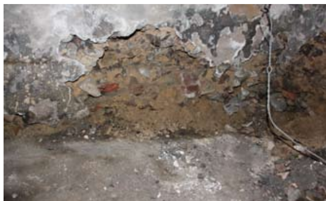
Rys. 5. Uszkodzenia konstrukcji ścian piwnicznych

W przypadku tego obiektu charakter spękań był podobny jak w przypadku budynku w Olsztynie – przechodził przez całą wysokość obiektu, głównie między