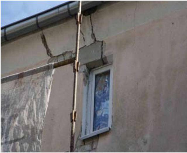
Rys. 3. Nadproże otworu okiennego

od nadproża otworu okiennego w piwnicy i biegły przez całą wysokość budynku między otworami okiennymi, aż do okapu budynku. Szerokość rys wahała się od 2 do 5 mm. Powołany zespół podczas pierwszej oceny dokonał dokładnej analizy stanu technicznego obiektu oraz rozpoznał jego konstrukcję. Jako wstępną hipotezę pogarszającego się stanu technicznego obiektu wskazano brak zwieńczenia obiektu. Wieniec z definicji jest belką żelbetową lub stalową, której zadaniem jest przeciwdziałanie siłom rozwarstwiającym działającym na konstrukcję murową obiektu [1]. W tym konkretnym przypadku siły działały w kierunku wolno stojącej ściany szczytowej budynku. Stwierdzono również, że charakter pęknięć jest konstrukcyjny i należy dokonać bardziej wnikliwej analizy stanu zachowania konstrukcji murowej po dokonaniu odkrywek. Ustalono, że odkryte zostaną fragmenty miejsc biegnące wzdłuż niektórych, wyselekcjonowanych rys.