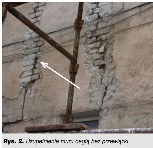
Rys. 2. Uzupelnienie muru cegłą bez przewiązki

Niepokój właścicieli budynku zaczęły budzić wyraźne, długie (na całej wysokości), poszerzające się rysy wszytkich z trzech ścian zewnętrznych. Rysy rozpoczynały się