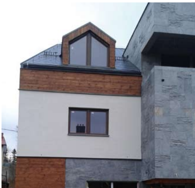
Rys. 2. Widok elewacji budynku z fragmentami okładziny drewnianej

W przeszłości okładziny drewniane wykonywane były głównie z desek oraz drewnianych elementów drobnowymiarowych – gontu, dachówki drewnianej, elementów ozdobnych i opasek okiennych. Były one wykonywane z taniego i łatwo dostępnego drewna tartacznego. Najczęściej pochodzącego z drzew iglastych, takich jak świerk, sosna, jodła lub modrzew.