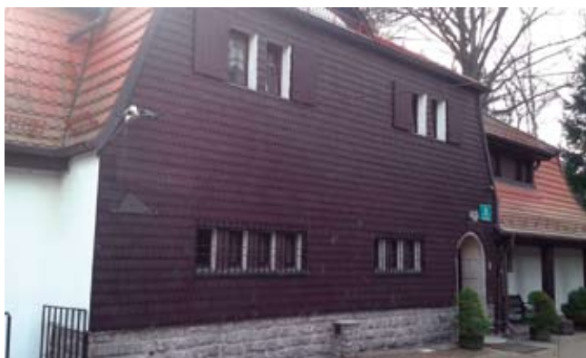
Rys. 1. Tradycyjna okładzina drewniana na elewacji

Drewno ze względu na swoją niepowtarzalną budowę i estetykę zawsze było wykorzystywane jako materiał wykończeniowy. Istotną zaletą tego materiału jest jego naturalne pochodzenie. Jest to zdrowy, ekologiczny materiał o dobrych właściwościach termoz izolacyjnych.