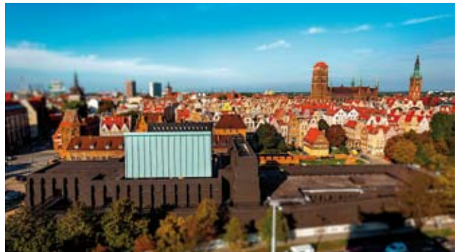
Gdański Teatr Szekspirowski

Wśród projektów znalazły się inwestycje z zakresu infrastruktury transportowej Gdańska z dziedzin drogownictwa, komunikacji miejskiej, transportu lotniczego i morskiego. Należy tu wymienić: Obwodnicę Południową, Trasę Sucharskiego (połączenie obwodnicy Południowej z Portem Morskim), Trasę W-Z, Trasę Słowackiego, a także kolejne etapy Gdańskiego Projektu Komunikacji Miejskiej oraz sieć tras rowerowych, a także inwestycje z zakresu bezpieczeństwa przeciwpowodziowego, czy rewitalizacji gdańskich dzielnic. Natomiast wśród ukończonych inwestycji kulturalno-edukacyjnych znalazły się takie inwestycje komunalne jak: Europejskie Centrum Solidarności, Centrum Hewelianum, czy Gdański Teatr Szekspirowski.