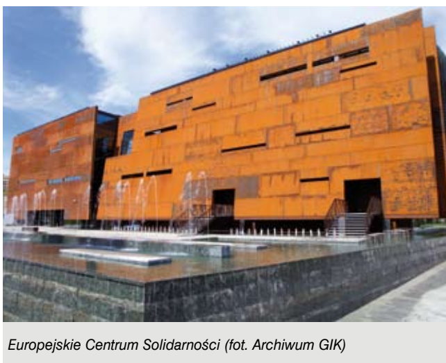
Europejskie Centrum Solidarności

Wpisując się w Strategię Rozwoju Miasta Gdańsk 2030 Plus wyodrębniliśmy pięć obszarów strategicznych rozwoju inwestycyjnego miasta, w ramach których planujemy zrealizować szereg inwestycji o istotnym znaczeniu dla mieszkańców. Zostały one szeroko skonsultowane w dialogu społecznym z ale też wynikają z naszych dotychczasowych doświadczeń inwestycyjnych.