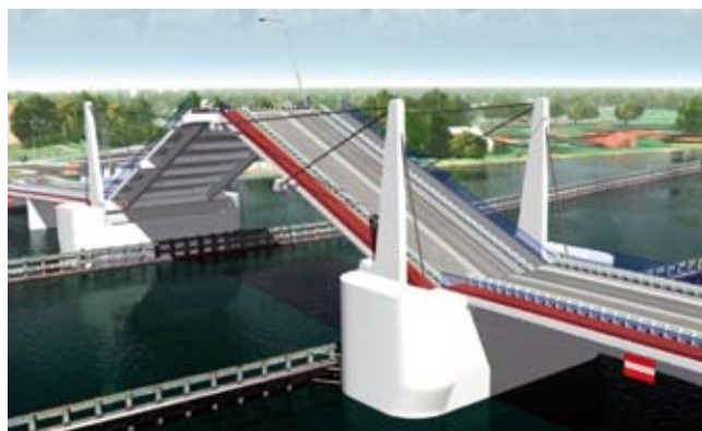
Wizualizacja ZDiZ Wizualizacja dostępna w formie prezentacji https://www.youtube.com/watch?v=UYAzWzDIZjk