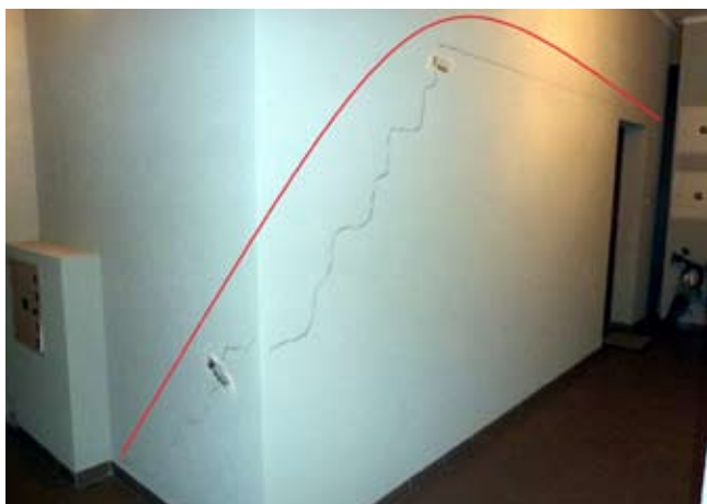
Fot. 2. Uszkodzona wskutek ugięć stropu ściana działowa z bloczków silikatowych o grubości 24 cm oraz kształt powstałego w ścianie łuku, utrzymującego w równowadze część ściany nad pęknięciem