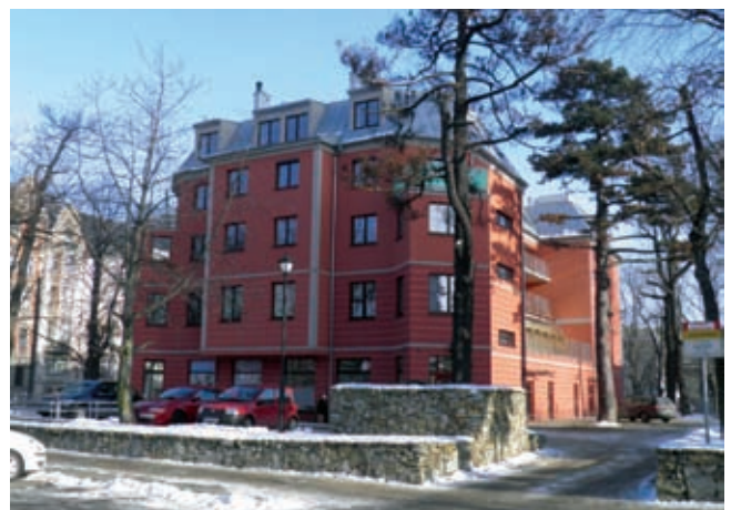
Fot. 1. Budynek, w którym wystąpiły nadmierne ugięcia stropów oraz wywołane nimi pęknięcia ścian działowych