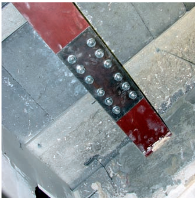
Fot. 4. Jedna z 2 stalowych belek podpierających ugięty strop Teriva nad parterem

stropu gęstożebrowego Teriva podparto od dołu poprzecznymi belkami z profili szerokostopowych HEA, zmieniając ich schemat z 1-przęstowych wolnopodpartych na 3-przęstowe [2]. Reakcje pionowe ze stalowych belek wzmacniających przekazano na poprzeczne ściany nośne niższej kondygnacji parteru (rys. 1, fot. 4). Zapewniono w ten sposób spełnienie warunków stanu granicznego nośności konstrukcji stropu.