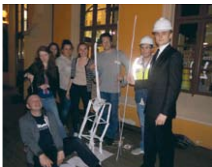
I Miejska Gra Inżynierska