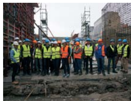
Uczestnicy Zjazdu na budowie rampy wjazdowej na parking podziemny przy NFM

Po południu delegaci Młodej Kadry zostali zaproszeni na zwiedzanie miasta z przewodnikiem. Uczestnicy mieli możliwość odwiedzenia najciekawszych punktów Wrocławia i podziwiania pięknej panoramy. Wieczorem podczas uroczystej kolacji nastąpiło oficjalne zamknięcie Zjazdu, po czym przyszedł czas na dobrą zabawę integracyjną, o którą dbał DJ Arti.