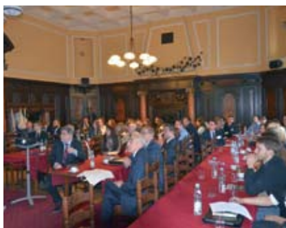
Uczestnicy podczas sesji naukowo-technicznej

Koło nr 1 przy Politechnice Wrocławskiej oraz Zarząd Wrocławskiego Oddziału PZITB zorganizowały 29-31 maja 2015 r. XIII Krajowy Zjazd Naukowo-Techniczny Młodej Kadry PZITB. Na te trzy dni Wrocław stał się stolicą środowiska młodych inżynierów i miał zaszczyt gościć 47 delegatów z 18 Oddziałów PZITB z całej Polski: Bydgoszczy, Bielska-Białej, Częstochowy, Gliwic, Gdańska, Katowic, Koszalina, Krakowa, Lublina, Łodzi, Opola, Olsztyna, Piotrkowa Trybunalskiego, Płocka, Poznania, Rzeszowa, Szczecina oraz Warszawy. W Zjeździe aktywnie uczestniczyło również 25 przedstawicieli Młodej Kadry z Wrocławia.