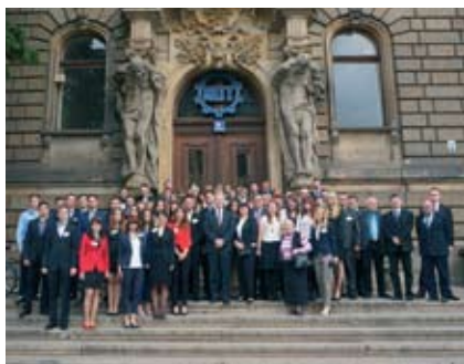
Uczestnicy Zjazdu przed budynkiem NOT we Wrocławiu

Po przerwie lunchowej przyszedł czas na sesję sprawozdawczą z działalności Młodej Kadry PZITB.