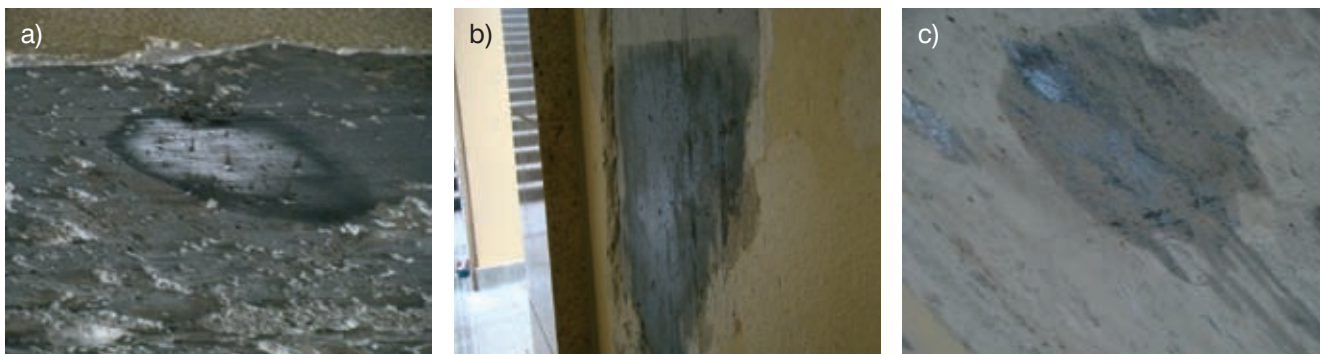
Rys. 3. Wynik zwilżania powierzchni (tzw. testu wody) na powierzchni elementów betonowych, z których odpadła wyprawa tynkarska: a) przekrycie (sufit), b) ściana tunelu oraz c) ściana pionowa obudowy wyjścia z tunelu (błyszcząca powierzchnia świadczy o występowaniu na powierzchni betonu warstwy hydrofobowej)

Na podstawie ogólnodostępnej literatury technicznej [1-11] można stwierdzić, że wraz ze wzrostem wytrzymałości betonu na ściskanie i przy wysokiej gładkości powierzchni spada przyczepność tynku do podłoża. Sytuacja ta spowodowana jest wysoką szczelnością matrycy cementowej oraz gładkością powierzchni betonu [1, 4].