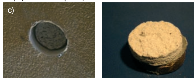
Mechanizm zniszczenia: 100% w tynku Naprężenie niszczące: 0,172 MPa

Rys. 5. Wyniki badań pull-off – widok miejsca wykonania testu oraz próbka po zniszczeniu: a) ściana pionowa obudowy wyjścia z tunelu, b) ściana pionowa tunelu, c) przekrycie (suffit) tunelu