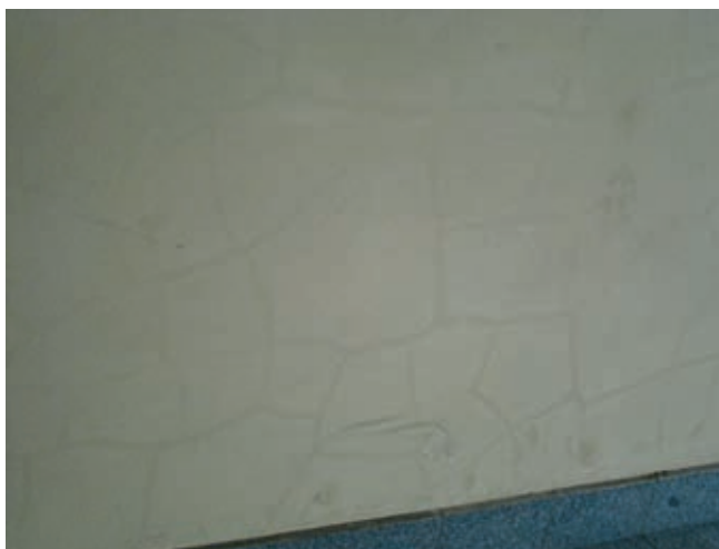
Rys. 4. Zarysowania wyprawy tynkarskiej ścian tunelu – typowa morfologia rys wywołanych skurczem tynku

W przypadku tunelu tynki na powierzchni elementów żelbetowych wykonane zostały jako tynki maszynowe o średniej grubości 2,0 cm. Analiza struktury tynku wskazała, że zostały one zrealizowane z zastosowaniem różnych materiałów: w wykonanych odkrywkach widoczna jest zróżnicowana struktura tynku, odpowiadająca odpowiednio tynkowi cementowemu (o zwartej strukturze porów i ciemniejszej barwie), jak również tynkowi cementowo-wapiennemu (o mniej zwartej strukturze i jaśniejszej barwie). Szczegółowa analiza dokumentacji procesu inwestycyjnego wykazała, że wykonawca zastosował na budowie dwa rodzaje mieszanek tynkarskich: 1) przeznaczoną do wykonywania tynków zewnętrznych i wewnętrznych (o strukturze odpowiadającej tynkowi