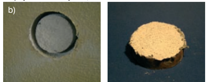
Mechanizm zniszczenia: 100% w tynku Naprężenie niszczące: 0,166 MPa