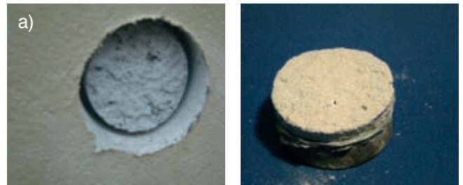
Mechanizm zniszczenia: 100% w tynku Naprężenie niszczące: 0,056 MPa