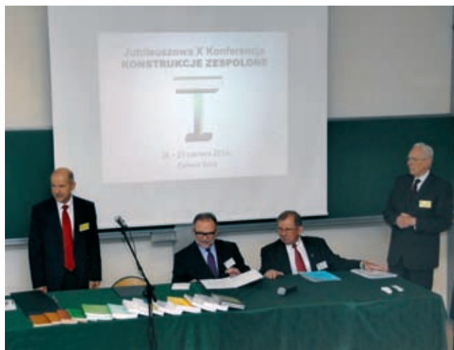
Otwarcie X Jubileuszowej Konferencji „Konstrukcje zespolone”