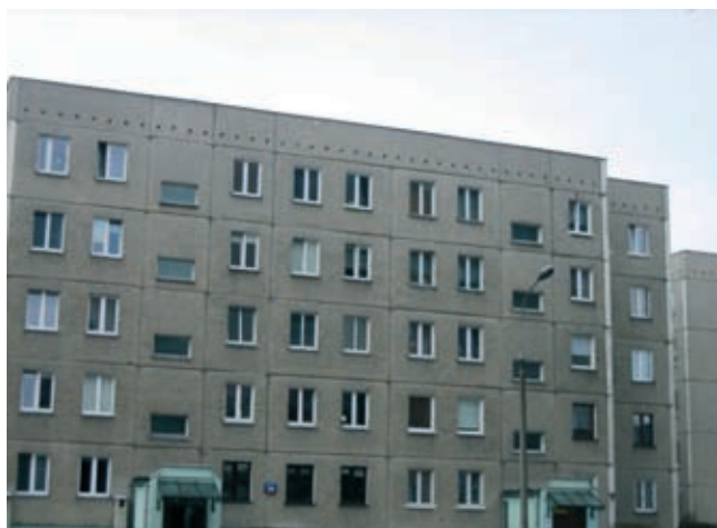
Rys. 3. Przykład wielkopłytyowego budynku mieszkalnego