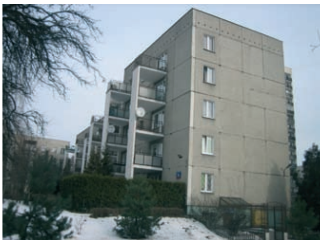
Rys. 5. Przykład budynku wielkopłytkowego o zróżnicowanym poziomie izolacyjności akustycznej wybranych elementów

mogą być wykryte na podstawie oględzin czy odkrywek. W przypadku, jeżeli na stropach wykonane były warstwy jastrychu cementowego i wykładziny podłogowe z warstwami izolacyjnymi (takie rozwiązania były dość powszechnie stosowane), pomiary izolacyjności od dźwięków uderzeniowych należy przeprowadzić dla stropów bez uwzględnienia nawierzchni podłogowych. Wyniki tych badań są niezbędne do prawidłowego doboru w danym przypadku rodzaju izolacyjnych konstrukcji podłogowych.