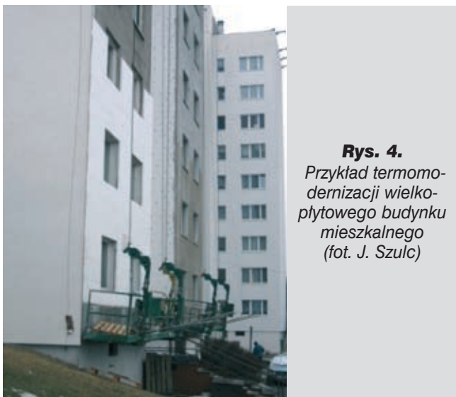
Rys. 4. Przykład termomodernizacji wielkopłytowego budynku mieszkalnego

Według założeń projektowych (funkcjonujących w okresie wznoszenia „wielkiej płyty”) ściany jednowarstwowe miały charakteryzować się współczynnikiem przenikania ciepła około 1,2, a trójwarstwowe około 0,7 W/(m 2 ·K). Badania izolacyjności cieplnej ścian budynków wielkopłytowych wykazały, że rzeczywiste wartości są niższe od 0,3–0,5 (w przegrodach jednowarstwowych) do 0,2 W/(m 2 ·K) (w przegrodach trójwarstwowych). Głównymi przyczynami pogorszenia ich izolacyjności cieplnej było stosowanie betonów o zwiększonej gęstości oraz różne niedokładności wykonania lub uszkodzenia warstwy izolacji cieplnej (rys. 4).