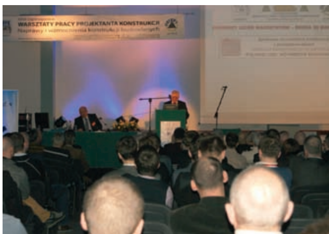
Fot. 1. Sala obrad w trakcie spotkania z „Patronem Branżowym” WPPK

Głównym organizatorem konferencji – tradycyjnie zawsze wtedy, gdy dotyczy ona konstrukcji żelbetowych – był Oddział PZITB w Gliwicach przy współ-