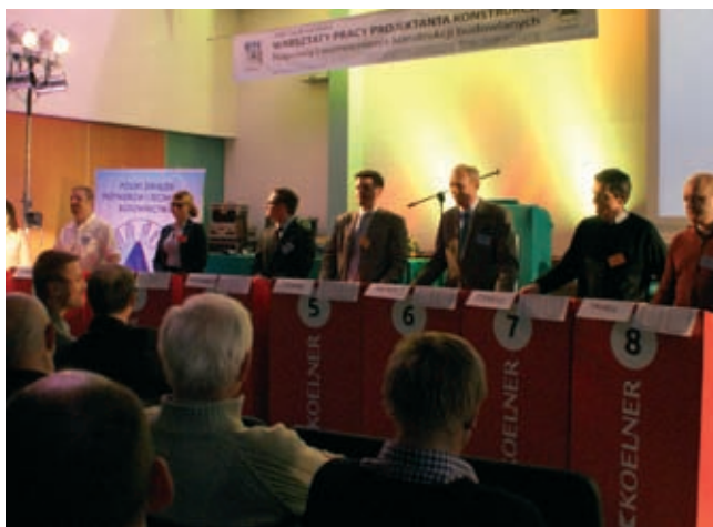
Fot. 6. Konkurs firmy RAWPLUG KOELNER