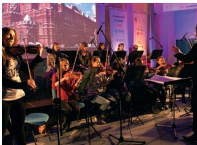
Fot. 7. Koncert Żeńskiej Orkiestry Salonowej Katowickiego Holdingu Węglowego pod dyrekcją Maestro Grzegorza Mierzwińskiego

Tradycyjnym tłem WPPK była wystawa, tym razem w sumie aż 53 firm i stowarzyszeń, co stanowi rekord konferencji.