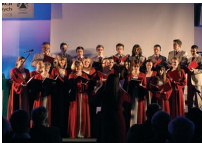
Fot. 2. Koncert Akademickiego Zespołu Muzycznego Politechniki Śląskiej