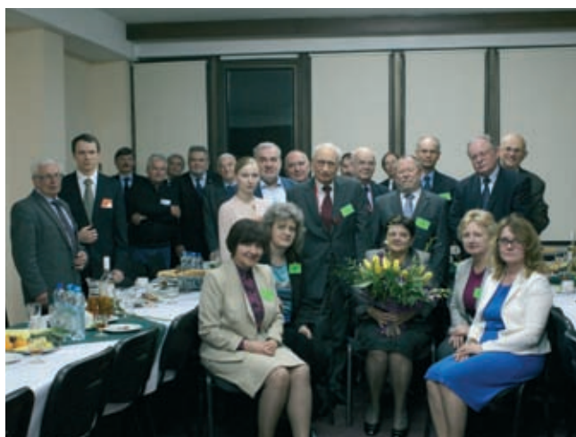
Fot. 9. Spotkanie Komitetu Organizacyjnego WPPK z Wykładowcami