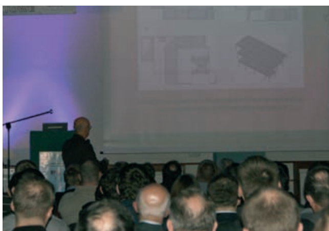
Fot. 8. Sala obrad w trakcie sesji plenarnej – wygłasza prof. Włodzimierz Starosolski

cji żelbetowych, napraw konstrukcji żelbetowych przez torkretowanie, uszczelnień wskrośnych przegród z betonu, metod napraw rys poprzez iniekcję oraz napraw dyatacji. Trzeci i czwarty dział dotyczył technologii robót przy pracach wzmacniających i nadbudowach i obejmował zagadnienia niszczenia i cięcia betonu, technologii wzmacniania konstrukcji taśmami i matami, stosowania kotew i trzpieni, a także zagadnień bezpieczeństwa przy prowadzeniu robót remontowych. Natomiast piąty dział związany był ze wzmocnieniami i nadbudową konstrukcji i zawierał wykłady poświęcone poszukiwaniu rezerw nośności przez analizę obliczeniową, wzmocnień konstrukcji żelbetowych przez konstrukcję żelbetową, wzmocnień elementami stalowymi oraz taśmami i matami wraz z metodami obliczeń. Ostatni szósty dział zawierał wykłady z zakresu napraw ustrojów szczególnych , w tym wzmacniania i remontów prostokątnych zbiorników, zagadnienia remontów budynków z „wielkiej płyty” oraz prostowania wychylonych budynków. Tegoroczne materiały konferencyjne stanowiły oczywiście kontynuację Warsztatowej „biblioteki projektanta” z poprzednich szesnastu edycji (1998–2013).