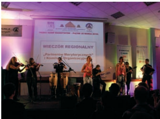
Fot. 10. Występ zespołu „Lemko Tower” w trakcie „Wieczoru regionalnego”

W 2006 roku w trakcie XXI WPPK, kiedy głównym organizatorem konferencji był Oddział PZITB w Gliwicach „Patronat Branżowy” objęła Rada Krajowa Polskiej Izby Inżynierów Budownictwa oraz Rady Okręgowe Małopolska oraz Śląska. Stało się już tradycją, że PIIB oraz ŚIOIB i MOIB obejmują patronatem konferencję rocznie. Stąd w pierwszym dniu konferencji odbyło się spotkanie uczestników z przedstawicielami „Patrona Branżowego” konferencji.