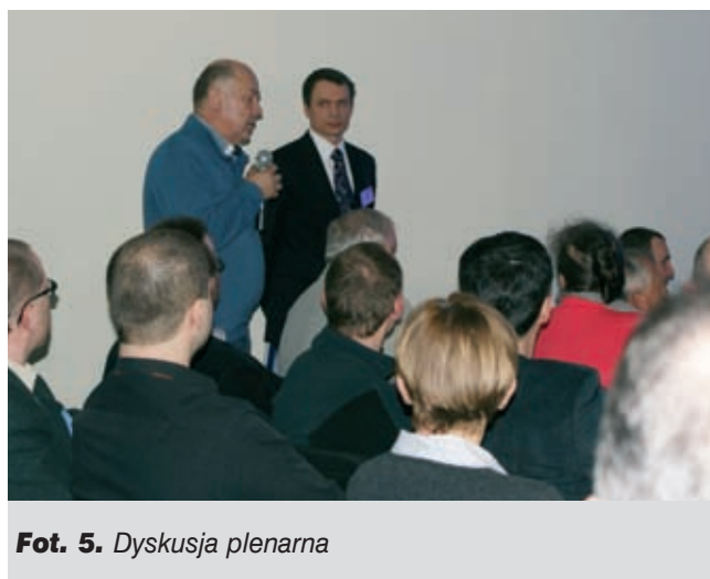
Fot. 5. Dyskusja plenarna

Czterodniowe obrady plenarne, trwały od rana do późnych godzin popołudniowych i wypełnione były przez wygłaszane i opublikowane 29 wykłady. Zestaw wykładów stanowił zwartą całość, gdyż zamawiany był przez organizatorów według szczegółowego scenariusza, którego autorem był prof. Włodzimierz Starosolski. Wykłady przygotowali Autorzy z uczelni, instytutów i pracowni projektowych. Materiał wykładowy został opublikowany w trzech tomach WPPK na około 1500 stronach oraz przekazany uczestnikom dodatkowo na specjalnie przygotowanych nośnikach elektronicznych. Poza dyskusjami prowadzonymi na sali obrad, przygotowane zostało przez organizatorów wydzielone miejsce nazwane „Salonem wykładowców”, w którym w nieskrępowanej atmosferze prowadzone były bezpośrednie rozmowy wykładowca-uczestnik.