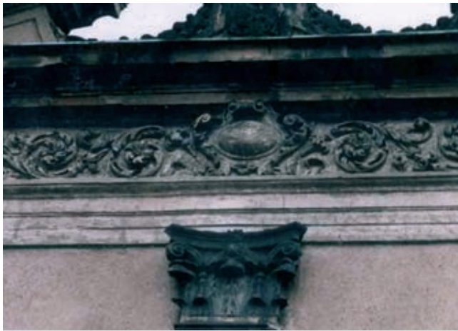
Rys. 6. Sztukateria w zwieńczeniu szczytu kamienicy pod Srebrnym Helmem, stan przed remontem