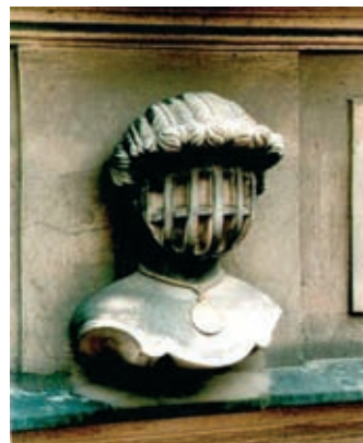
Rys. 8. Piaskowcowe godło kamienicy pod Srebrnym Helmem w kondygnacji parteru

1. Nałożenie warstwy szpachlówki egalizującej wzmocnionej włóknem zbrojącym Keim Uniputz grubości około 3 mm i filcowanej.