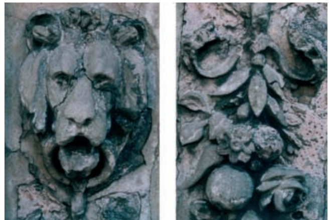
Rys. 2. Fragment sztukaterii gipsowej na jednym z pasów tynku kondygnacji 3 piętra kamienicy pod Srebrnym Hełmem, stan przed remontem

W równie złym stanie zachowane były barokowe sztukaterie I i II piętra. Powierzchnia zaprawy na wystających elementach była mocno wypłukana. W dużym stopniu sztukaterie