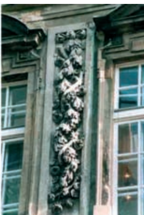
Rys. 5. Sztukateria wapienna (barokowa) między oknami 2 piętra kamienicy pod Srebrnym Helmem, stan przed remontem