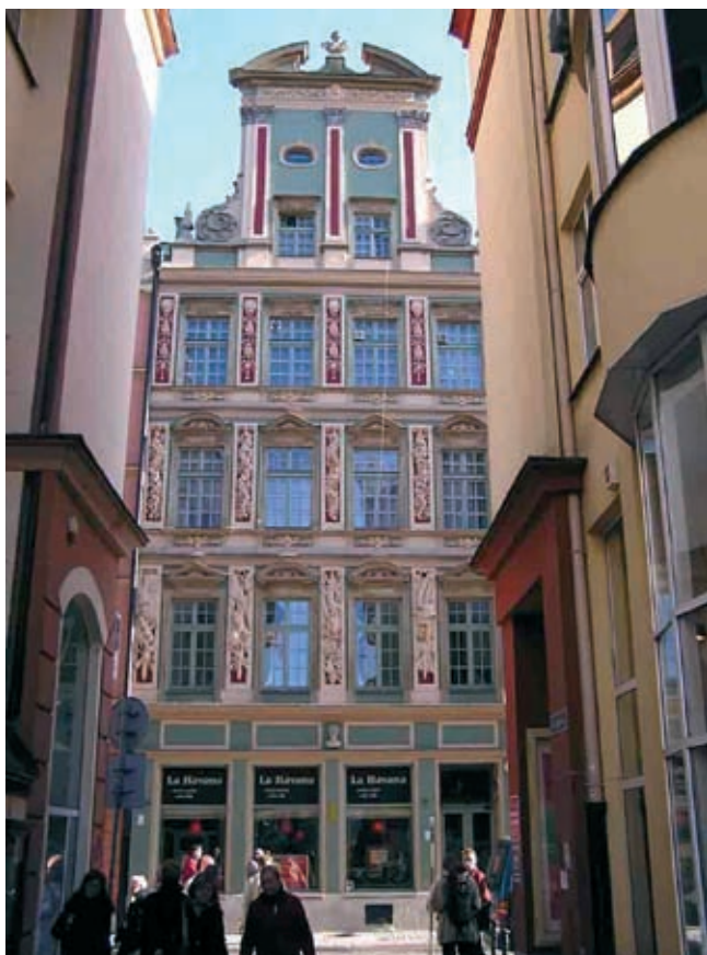
Rys. 9. Ornament gipsowy między oknami kondygnacji 3 piętra kamienicy pod Srebrnym Hełmem, stan przed remontem