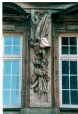
Rys. 4. Sztukateria wapienna (barokowa) między oknami 1 piętra kamienicy pod Srebrnym Helmem, stan przed remontem