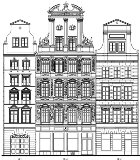
Rys. 1. Widok elewacji frontowych kamienic przy ul. Kuźniczej 11, 12, 13. Oprac. A. Guerquin 1

Wiosną 1945 roku, w wyniku działań wojennych, kamienica została znacznie zniszczona. W latach 1969–1972 kamienica zostaje poddana odbudowie wg projektu