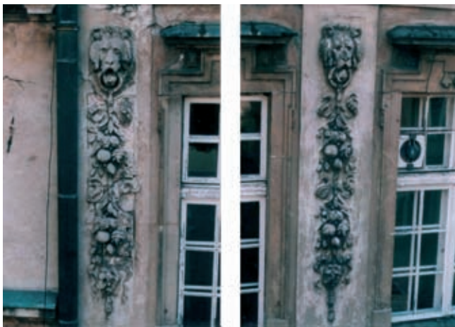
Rys. 3. Ornament gipsowy między oknami kondygnacji 3 piętra kamienicy pod Srebrnym Helmem, stan przed remontem

te zostały uzupełnione zaprawą cementową (około 40%). Stwierdzono, że powierzchnia panopliów (I piętro) została przetarta cienką mocną warstwą zaprawy cementowej niemal w całości. Przeprowadzone odkrywki pokazały również, że zafałszowano pierwotną formę detalu zarzucając go i ponownie modelując zaprawą cementową, pod którą zachowała się jego pierwotna forma.